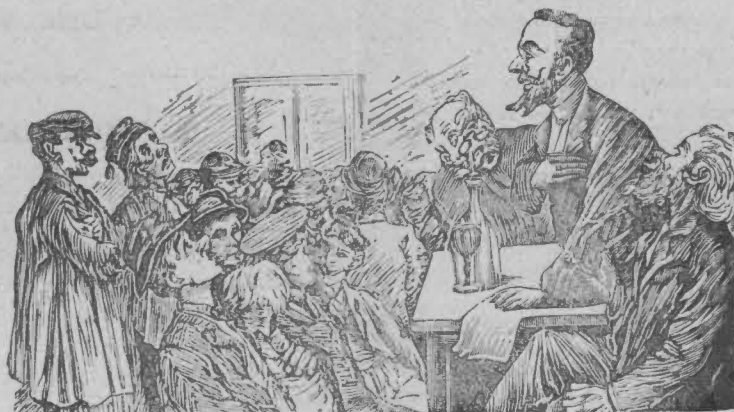
Ἐπί τῶν δικαιωμάτων τῆς γυναίκος.

Ὁ ρήτωρ: Μάλιστα, κύριοι! ὑπερμαγῶ εἶ δλης καρδίας ὑπὲρ τῶν δικαιωμάτων τῆς γυναίκος! τὴν θέλω ανεξάρτητον και ἀ- πολύουσαν ὅλων τῶν περιπορήσεων και ὅλου τοῦ σεβασμοῦ μας!